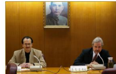
970411討論會選入新世紀的臺灣——象徵、儀式與偏見的變更