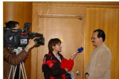
970411討論會選入新世紀的臺灣——象徵、儀式與偏見的變更